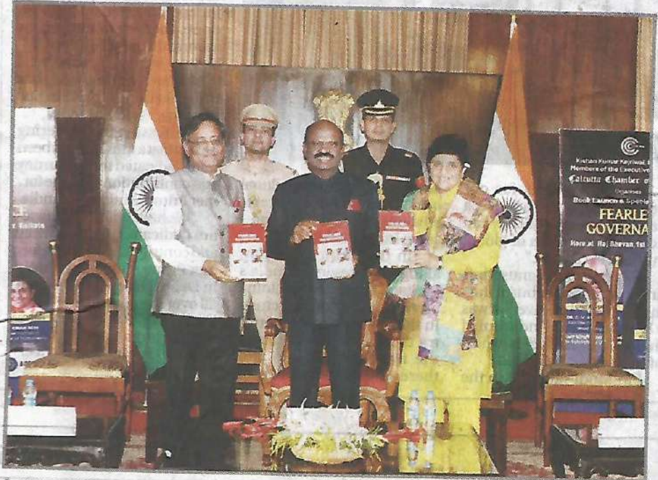
Governor CV Ananda Bose releases Fearless Governance, book written by Dr Kiran Bedi at Raj Bhavan on Thursday.